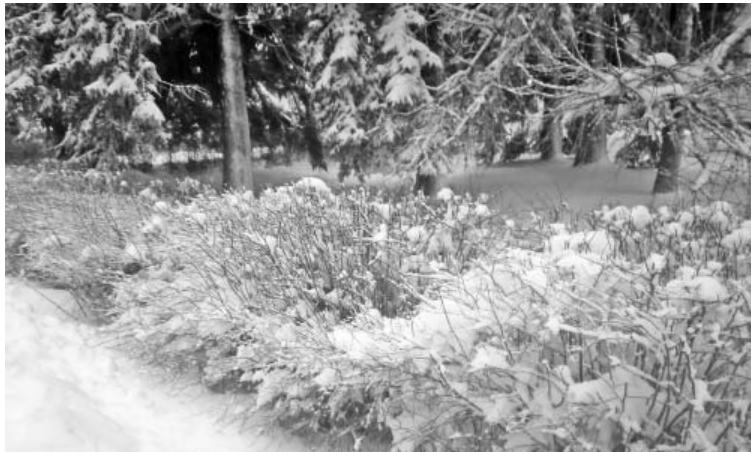
Таким нас встретило утро среды. Морозец. Снежно. Красиво.